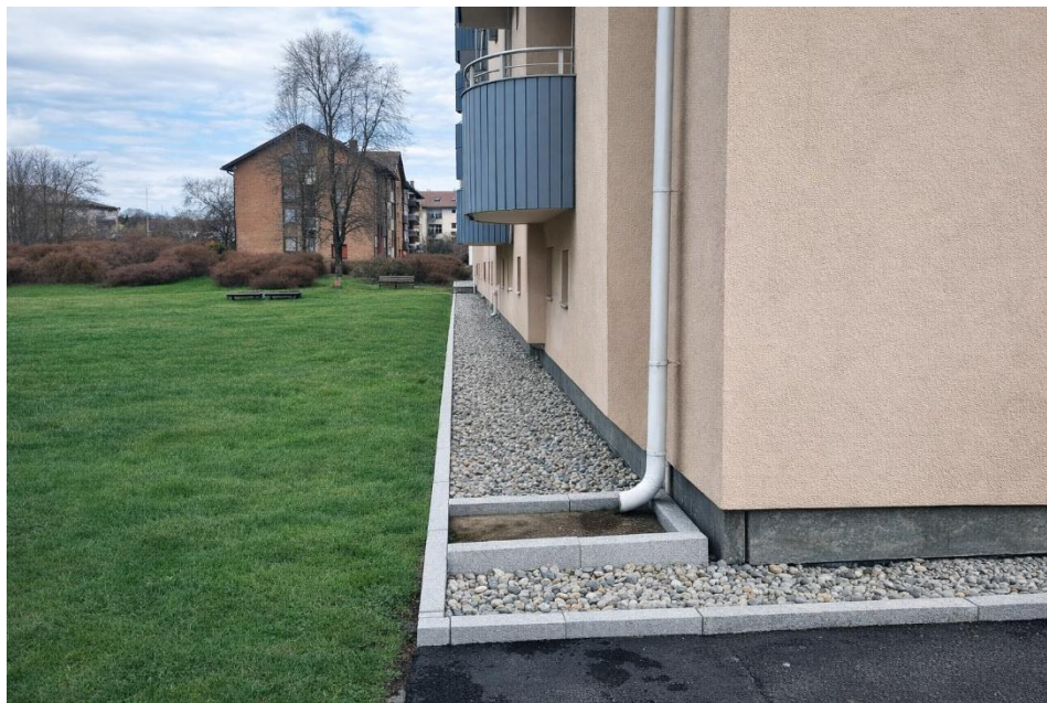
Eksempelbilde fra Nygård brl. Utført i 2025

For å hindre ugress opp på fasade og for å legge vedlikehold og gressklipping foreslår vi en kant av granitt med elvestein mot fasade