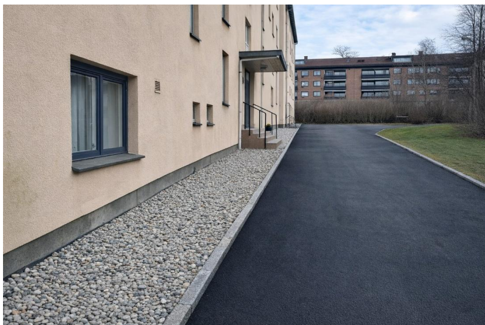
Eksempelbilde fra Nygård brl. Utført i 2025