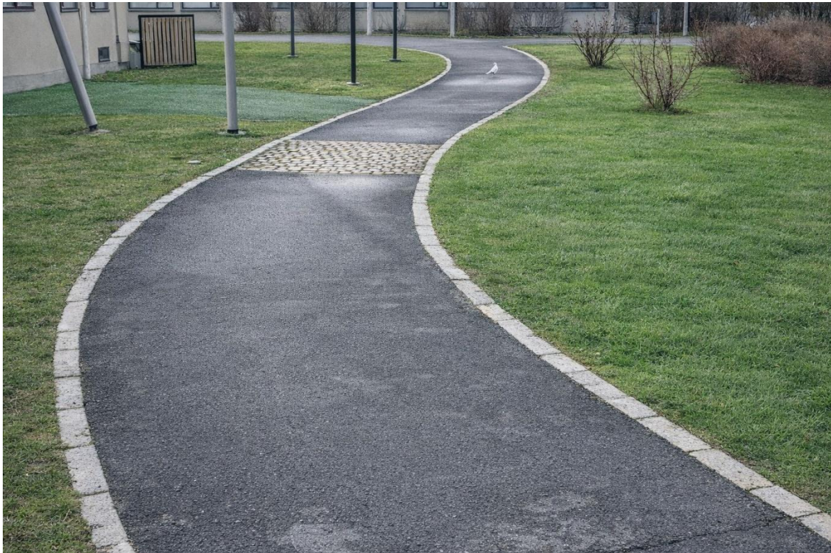
Eksempelbilde fra Kringsjø 2024

Også her satt med 0-vis for å lette gressklipping